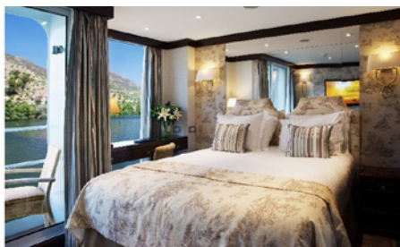
Cabine Deluxe Balcon pont Panorama