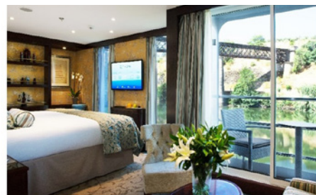
Junior Suite Balcon pont Panorama