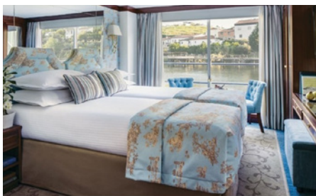
Cabine Deluxe Baie vitrée pont Supérieur

Toutes les cabines sont équipées de 2 lits pouvant être rapprochés ou séparés, d'une climatisation individuelle, d'une télévision, d'un sèche-cheveux, d'un coffre-fort, d'une salle de douche et de toilettes. Les Junior Suites disposent également d'un coin salon.