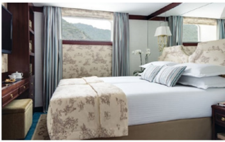
Cabine Confort Fenêtre pont Principal