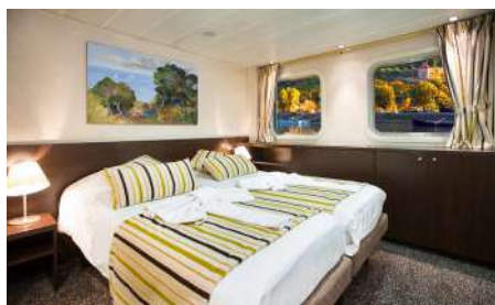
cabine double deux lits séparables pont-principal-MS-Vivaldi