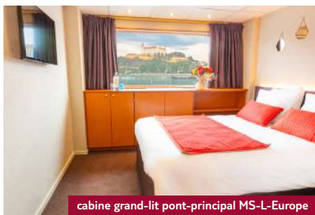
cabine grand-lit pont-principal MS-L-Europe