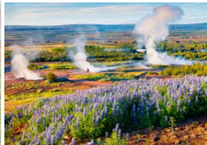
zone de Geysir