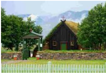
Eglise de Vidimyri

côtes de la péninsule de Vatnsnes depuis Hvammstangi. Terminez la journée en vous rendant à Akureyri, deuxième ville du pays située au fond d'un fjord. Vous pouvez monter jusqu'à l'église dont l'architecture rappelle les formations d'orgues basaltiques. Nuit dans la région d'Akureyri.