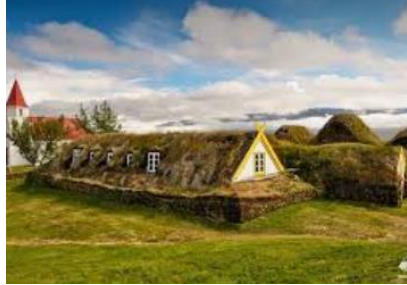
ferme-musée de Glaumbaer