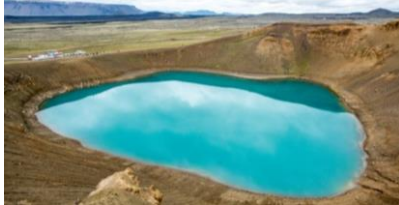
Cratère de Viti