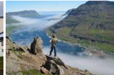
Les fjords de l'Est