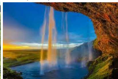
chute de Seljalandsfoss