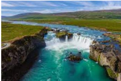
chutes de Godafoss