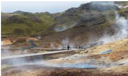
zone géothermique de Krýsuvík

Envol pour Keflavik. Prise en charge de votre véhicule à l'aéroport. Selon l'horaire de votre arrivée, visitez la zone géothermique de Krýsuvík (mares bouillonnantes, solfatares, fumerolles) et/ou détendez-vous au Blue Lagoon réputé pour ses eaux turquoise, douces, chaudes (37° à 39°) et relaxantes. Nuit dans la région de Reykjavik.