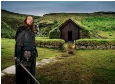
ferme viking Stöng

OU, vous êtes plutôt fan de la série Game of Thrones® ? Partez dans la vallée de Thjórsárdalur découvrir l'ancienne ferme viking Stöng et la gorge Gjáin .