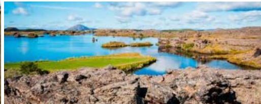
Lac de Mývatn