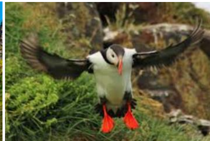
Macareux île d'Heimaey