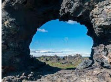
grottes de Dimmuborgir