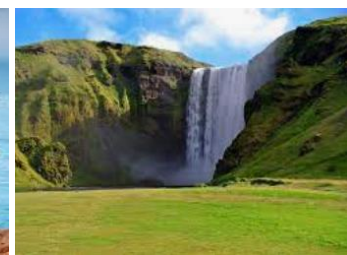
chute de Skógafoss.