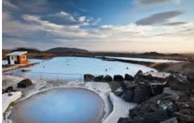
Centre thermal de Myvatn