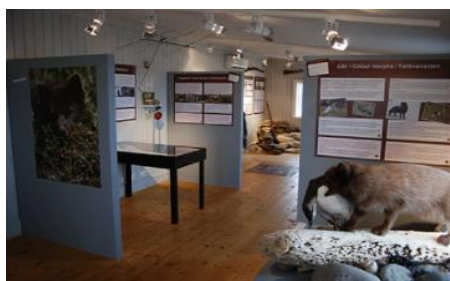
Fox arctic center