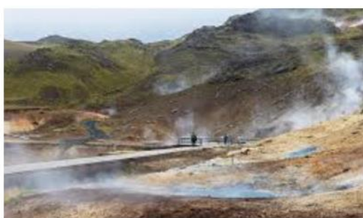
zone géothermique de Krýsuvík

Envol pour Keflavik. Prise en charge de votre véhicule à l'aéroport. Selon l'horaire de votre arrivée, visitez la zone géothermique de Krýsuvík (mares bouillonnantes, solfatares, fumerolles) et/ou détendez-vous au Blue Lagoon réputé pour ses eaux turquoise, douces, chaudes (37° à 39°) et relaxantes. Nuit dans la région de Reykjavik.