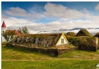
ferme-musée de Glaumbaer