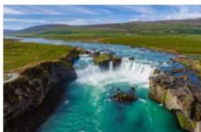
Chutes de Godafoss