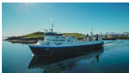
baie du Breidafjörður

Petit déjeuner. Traversée (incluse) de la baie du Breidafjörður, en car-ferry, de Stykkishólmur à Brjánslækur (3 h env.) . Cette baie est parsemée de plus de 2 500 îles, îlots et autres récifs. C'est de ces îles qu'Erik le Rouge embarqua pour coloniser le Groenland. Avec les fjords du Nord-Ouest, vous voici aux confins de l'Europe, à moins de 300 kilomètres du Groenland. Montagnes rocheuses, falaises, fjords composent un décor de toute beauté mais hostile, où les hommes vivent de la pêche, et où les oiseaux ont trouvé leur Eden. Brjánslækur se trouve à l'embouchure du Vatnsfjörður. C'est dans cette région qu'un viking appela l'île nouvellement découverte Islande, terre de glace, en raison du spectacle qui s'offrait devant lui : un fjord pris dans les glaces. Direction Patreksfjörður. Ne manquez pas de faire un détour par Raudisandur, la « plage au sable rouille » . En surplomb du lagon de Baejarvadall, l'église de Saurbaer domine l'ensemble de la baie. Non loin, rendez-vous à Látrabjarg, la pointe la plus septentrionale de l'Islande. Longues de 14 km et d'une hauteur de près de 450 m, ces falaises abritent de nombreuses colonies d'oiseaux dont la plus importante colonie au monde de pingouins torda, mais aussi les macareux moines. Malgré son phare, le cap reste dangereux comme en témoignent les nombreux naufrages. Nuit dans la région de Patreksfjörður.