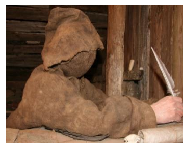
Holmavik musée de la sorcellerie