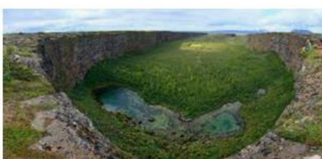
canyon d' Ásbyrgi