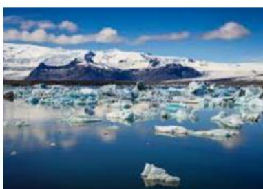
lagon de Jökulsárlón