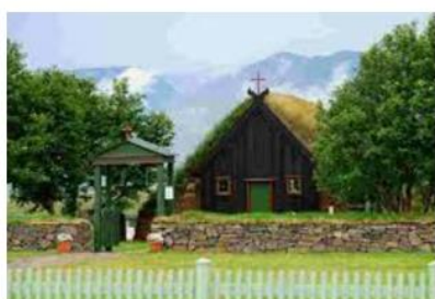
Eglise de Vidmuri

entre clans islandais du 13 e siècle au cours d'une expérience immersive, et d'objets et de costumes d'époque. Hofsos , situé sur la rive est du Skagafjordur, abrite un musée consacré à l'émigration des Islandais au Canada et aux Etats-Unis et un bassin d'eau chaude pour se détendre au bord d'un fjord. Le site du village d'Olafsjordur est magnifique : un amphithéâtre de montagnes aux sommets coiffés de neige qui culminent à 1 200 m. Arrivée à Akureyri, deuxième ville du pays située au fond d'un fjord. Pour mieux s'imprégner de la ville, montez jusqu'à l'église dont l'architecture rappelle les formations d'orgues basaltiques. Nuit dans la région d'Akureyri.