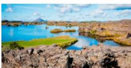
Lac de Mývatn