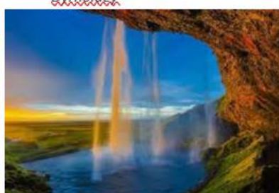
chute de Seljalandsfoss