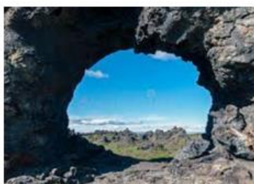
grottes de Dimmuborgir