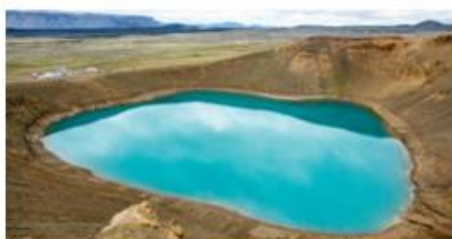
Cratère de Viti