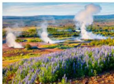
zone de Geysir