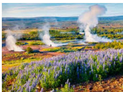
zone de Geysir

Petit déjeuner. À Geysir , admirez le spectacle de son geyser, le Strokkur , qui jaillit à 30 m toutes les 5 minutes. Quelques kilomètres plus loin poursuivez jusqu'à l'impressionnante cascade à deux niveaux de Gullfoss « la chute d'or », l'une des plus célèbres d'Islande, parfois couronnée d'un arc-en-ciel. Route jusqu'à la faille de Thingvellir** qui résume à elle seule l'histoire humaine du pays, puisqu'elle réunissait le Parlement islandais et l'histoire géologique, pour sa situation sur une zone d'intenses activités tectoniques. Une faille tectonique longue de plusieurs kilomètres et haute de plus de 30 m parcourt en effet le site. Elle marque la limite à l'ouest du bassin d'effondrement entre l'Amérique et l'Europe. Les Islandais tirent une grande fierté de leur parlement, l'Althing car peu après l'installation des premiers Vikings au 10 e siècle, ce lieu accueillit une assemblée d'hommes libres se réunissant chaque année au solstice d'été. C'est sur ce même site que l'indépendance de l'île est proclamée en 1944. Nuit dans la région de Stykkisholmur.