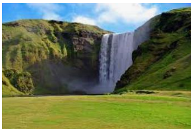
chute de Skógafoss.

Petit déjeuner. Route le long de la côte sud, vers une région agricole parsemée de petites fermes. Arrêt conseillé à la chute de Skógafoss . D'une hauteur de 60 m, cette chute constitue le dernier élément d'une série de 20 cascades sur la rivière Skógora qui sépare les glaciers Myrdalsjökull et Eyjafjallajökull, ce fameux volcan qui a fait tant parler de lui depuis son éruption en 2010. À Skógar , ne manquez pas son musée aux vieilles fermes de tourbe couvertes d'herbe. Excursion conseillée sur le glacier Sólheimajökull ou à Dyrhólaey site privilégié pour l'observation des oiseaux dont les macareux. Près de Vík, vous pourrez admirer les aiguilles rocheuses en mer de Reynisdrangar. Non loin, marchez sur la très belle plage de sable noir de Reynisfjara où l'on peut admirer les formations géologiques insolites que sont les colonnes basaltiques de forme hexagonale. Installation pour 2 nuits dans la région, entre Vík et Skaftafell.