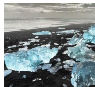
plage de Diamant