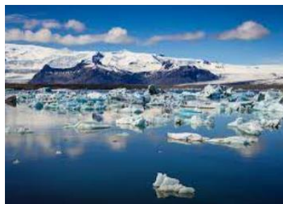
lagon de Jökulsárlón