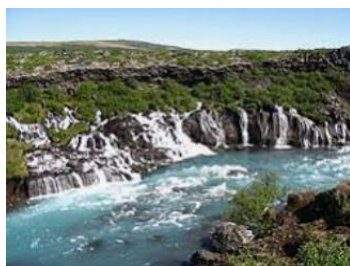
Chutes de Hraunfossar

Petit déjeuner. Situées à 20 km environ à l'est de Reykholt, détour par Hraunfossar qui constitue un bel ensemble de cascades descendant le long d'une coulée de lave avant de se jeter dans la rivière Hvita. Selon vos centres d'intérêts, découverte de Reykjavik , la capitale de l'Islande, qui rassemble la moitié de la population de l'île. Si la ville, est très étendue, le centre-ville et ses environs immédiats regroupent les principaux points d'intérêts comme les récentes attractions situées dans le vieux port (FlyOver Iceland, Northern Lights Center). Les maisons colorées et les petites rues du centre-ville paisibles invitent à la promenade. Nuit dans la région de Reykjavik.