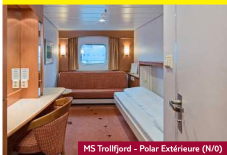
MS Trollfjord - Polar Extérieure (N/O)