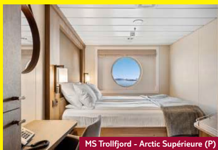
MS Trollfjord - Arctic Supérieure (P)