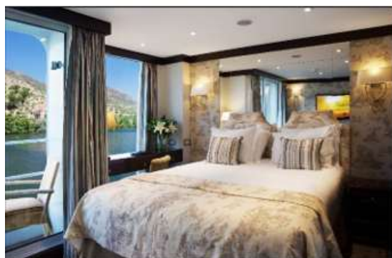
Cabine Deluxe balcon pont Panorama