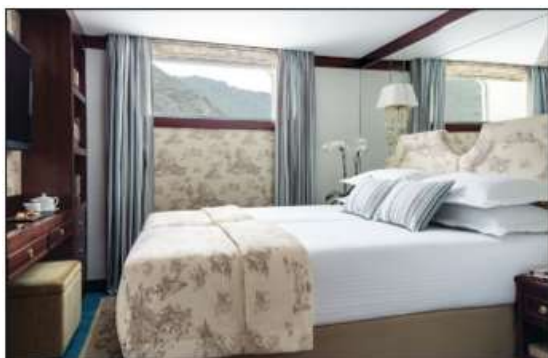
Cabine Confort Fenêtre pont Principal

Toutes les cabines sont équipées de 2 lits pouvant être rapprochés ou séparés, climatisation individuelle, télévision, sèche-cheveux, coffre-fort, salle de douche et WC. Les Suites Balcon disposent d'un coin salon.