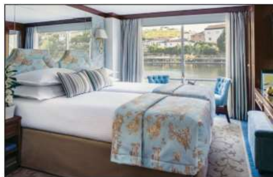
Cabine Deluxe Baie vitrée pont Supérieur