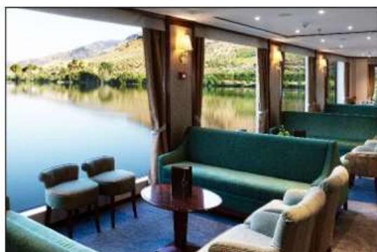
Salon - Bar