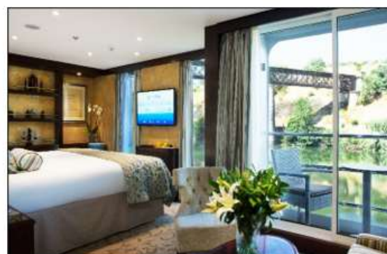
Junior Suite Balcon pont Panorama