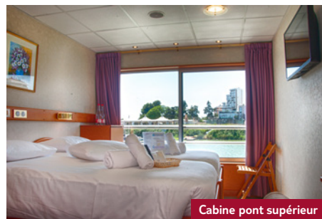
Cabine pont supérieur