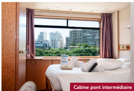
Cabine pont intermédiaire