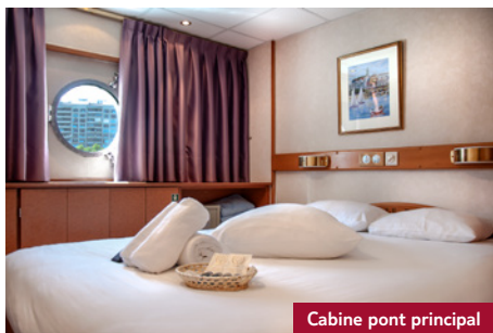
Cabine pont principal

Desservies par un ascenseur, les cabines réparties sur 3 ponts sont toutes extérieures. Elles sont équipées d'une salle d'eau avec douche et toilettes, d'une TV, d'une climatisation réversible, d'un téléphone intérieur, d'un sèche-cheveux et d'un coffre-fort. Electricité : 220V. Wifi. Les cabines du pont supérieur disposent de larges baies vitrées avec balcon à la française, celles du pont intermédiaire ont de larges fenêtres et celles du pont principal sont pourvues de hublots.