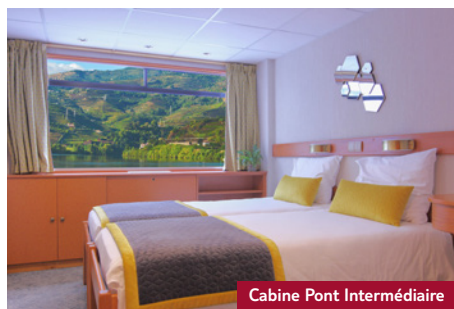
Cabine Pont Intermédiaire