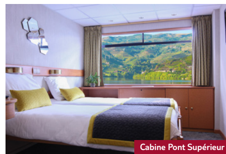
Cabine Pont Supérieur