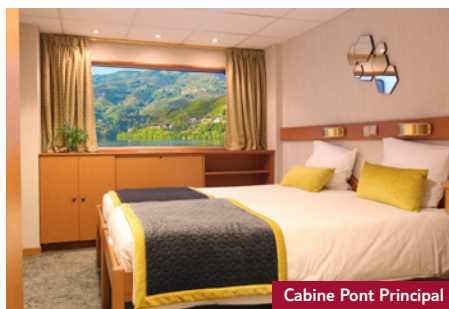
Cabine Pont Principal