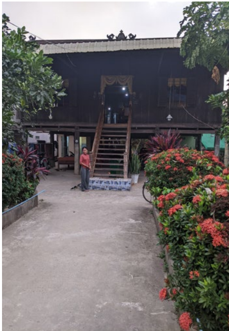
Maison chez l'habitant - ile de Koh Trong sur le Mékong