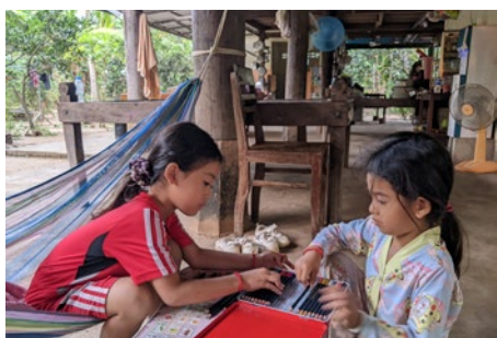
petites filles chez l'habitant - ile de Koh Trong sur le

Dans 1 ou 2 étapes dans les contrées peu développées du Mondolkiri et du Ratanakiri avec peu de choix de restaurants, les repas seront simples !