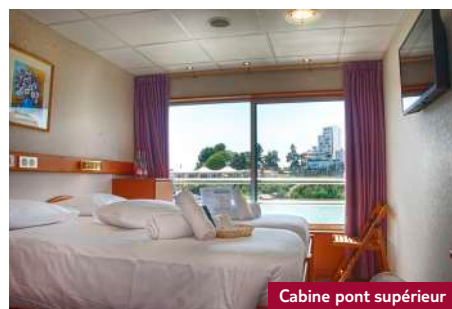
Cabine pont supérieur