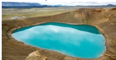
Cratère de Viti