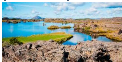
Lac de Mývatn