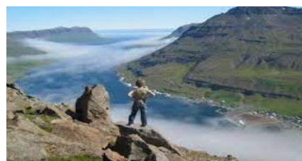
Les fjords de l'Est