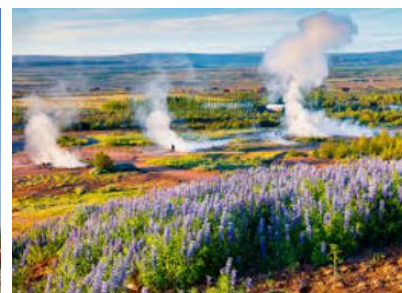
zone de Geysir