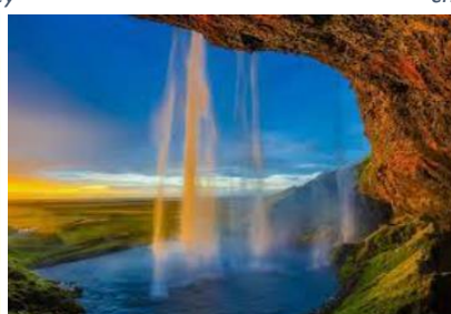
chute de Seljalandsfoss