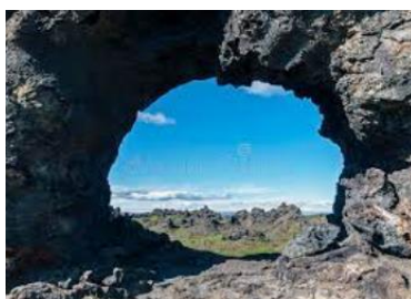
grottes de Dimmuborgir