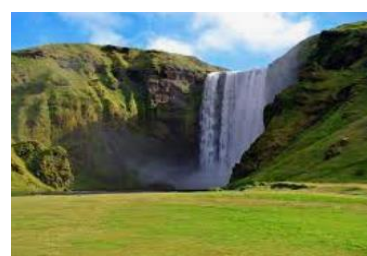
chute de Skógafoss.