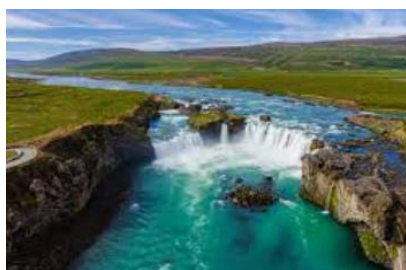
Chutes de Godafoss

Baignade conseillée dans les eaux chaudes (38° à 41°) au centre thermal de Mývatn. Nuit dans la région de Mývatn ou d'Húsavík.