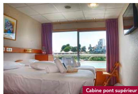
Cabine pont supérieur