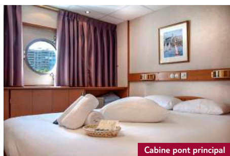
Cabine pont principal